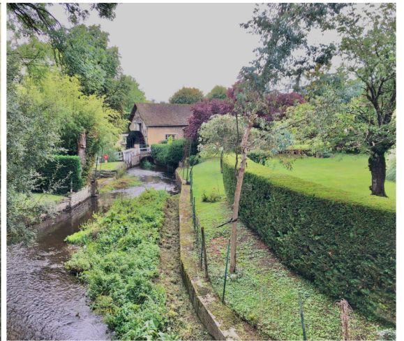
Le Moulin de la Folie...il y a quelques dizaines d'années et aujourd'hui