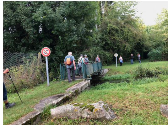
Lavoir et passerelle sur la Vesgre