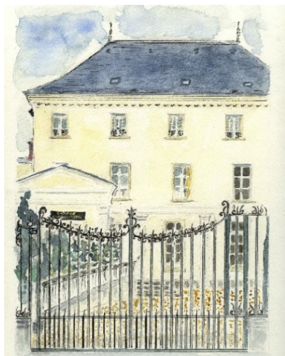
Centre Pierre MARRIE Aquarelle de Jacqueline SCHMITT

Pour connaître la vie de notre Université, consultez notre nouveau site : www.udtl-dreux.fr